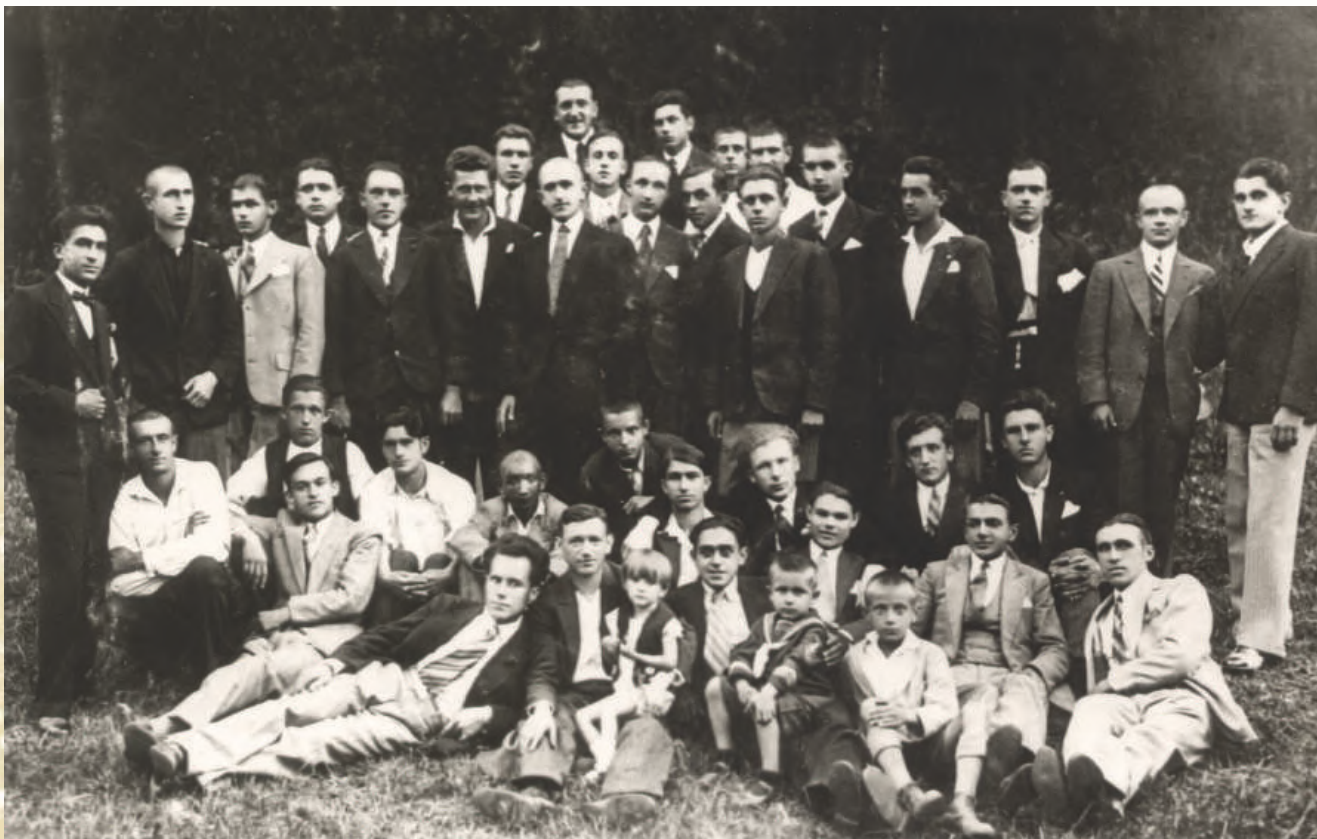
Хор „Абрашевић“ 1932. године