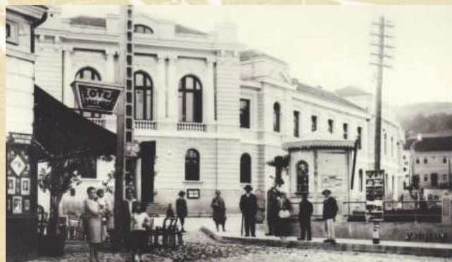
Хотел „Златибор“ (лево)