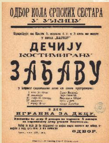
Новински оглас Кола српских сестара за Дечју костимирану забаву 1931. године