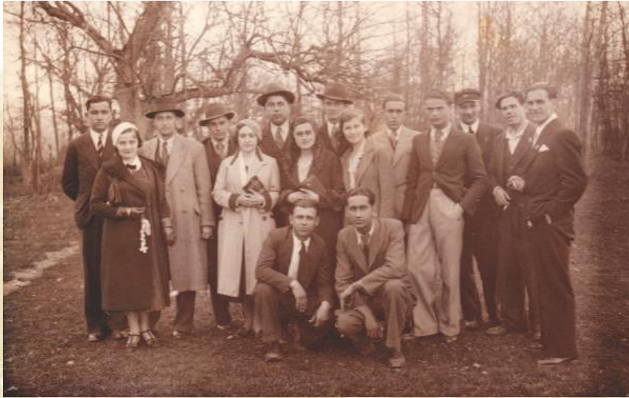
Друштво трезвене младежи на излету у околини Пожеге 1932. године