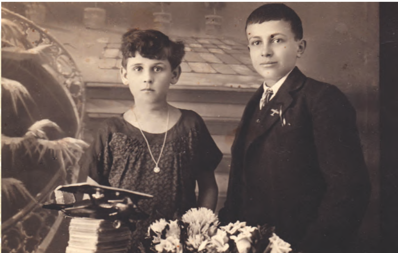
Радничка забава у Ужицу, 25. фебруар 1928. године