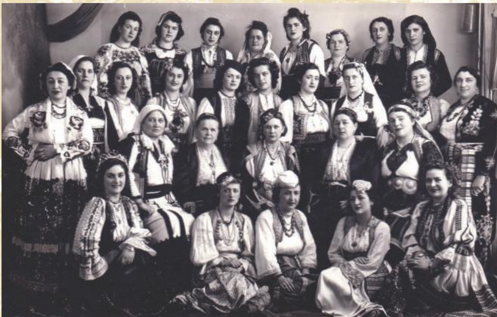
Костимирана забава Кола српских сестара 1937. године