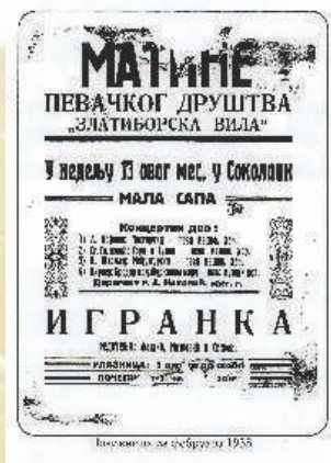
Матине Певачког друштва „Златиборска вила“ 1938. године