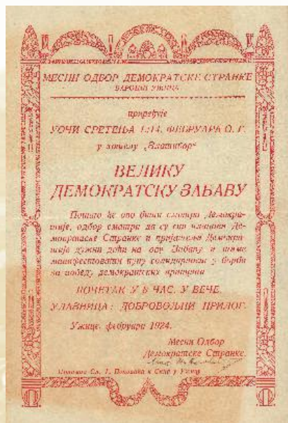
Забава Демократске странке у Ужицу 1924. године