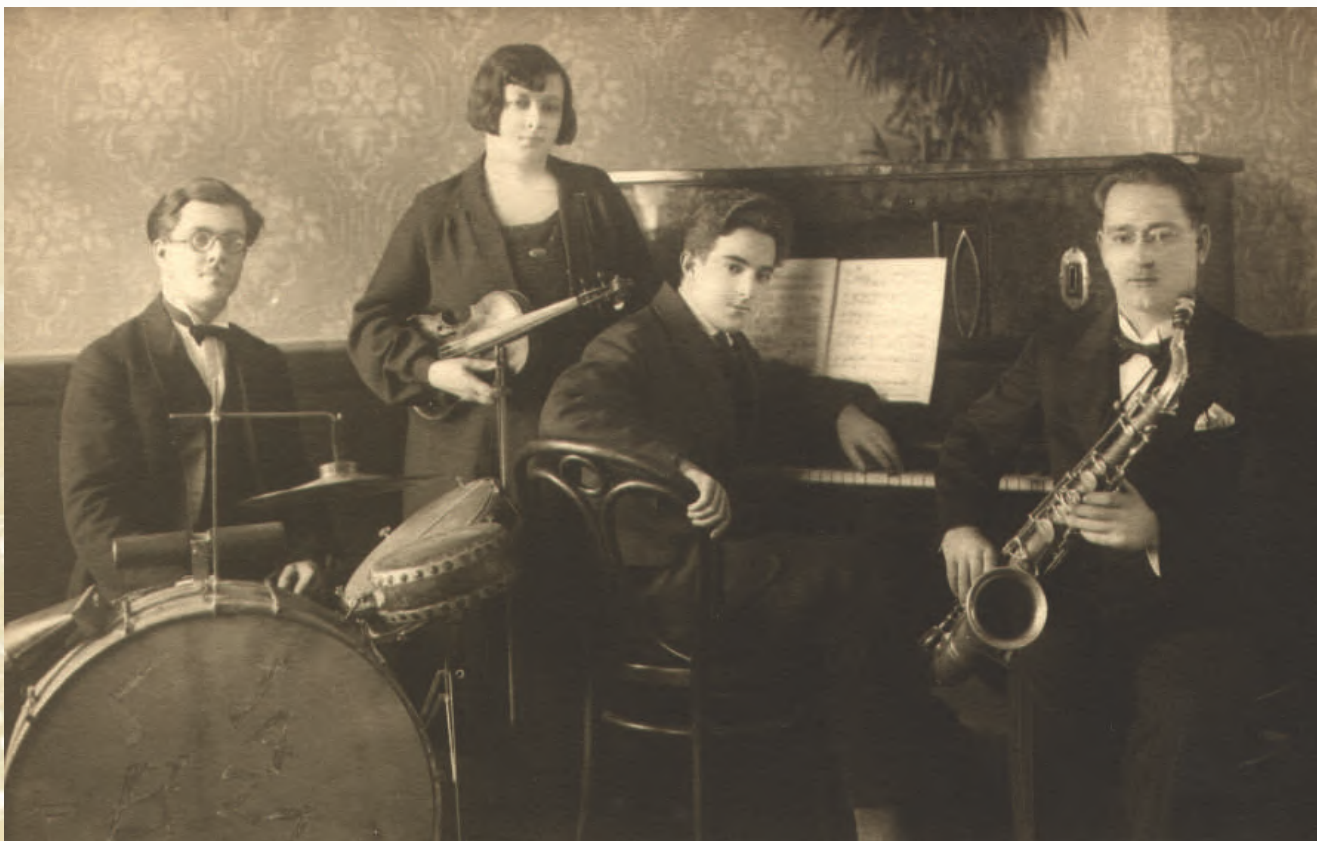
Музика у хотелу „Златибор“