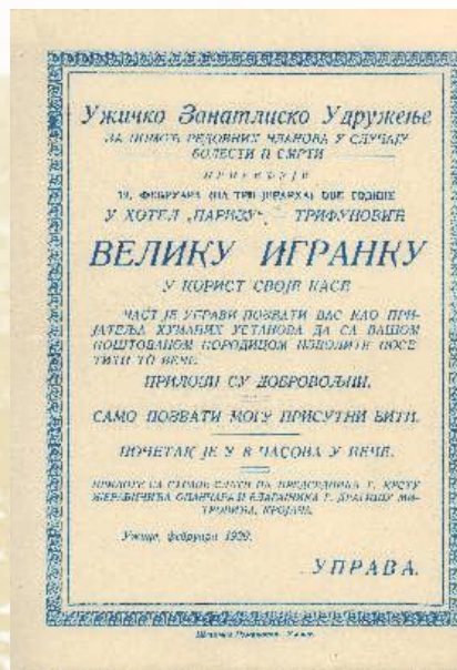
Забава Ужичког занатлијског удружења 1929. године