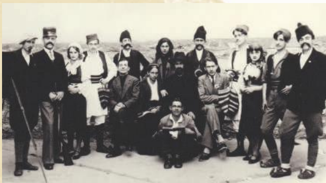
Ученици Гимназије и Учитељске школе после представе Два цванцика