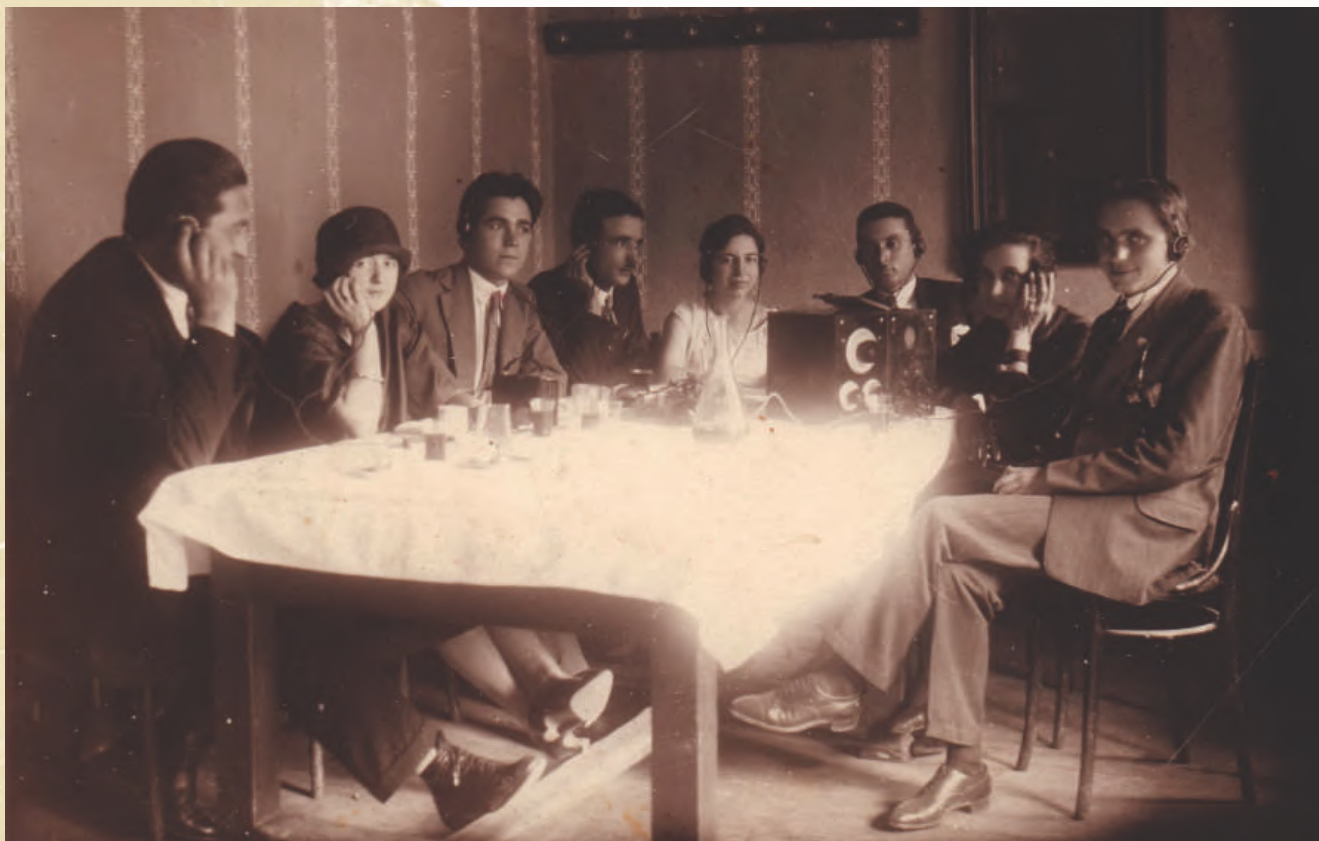
Први радио-апарат у хотелу „Касина“, 1925. године