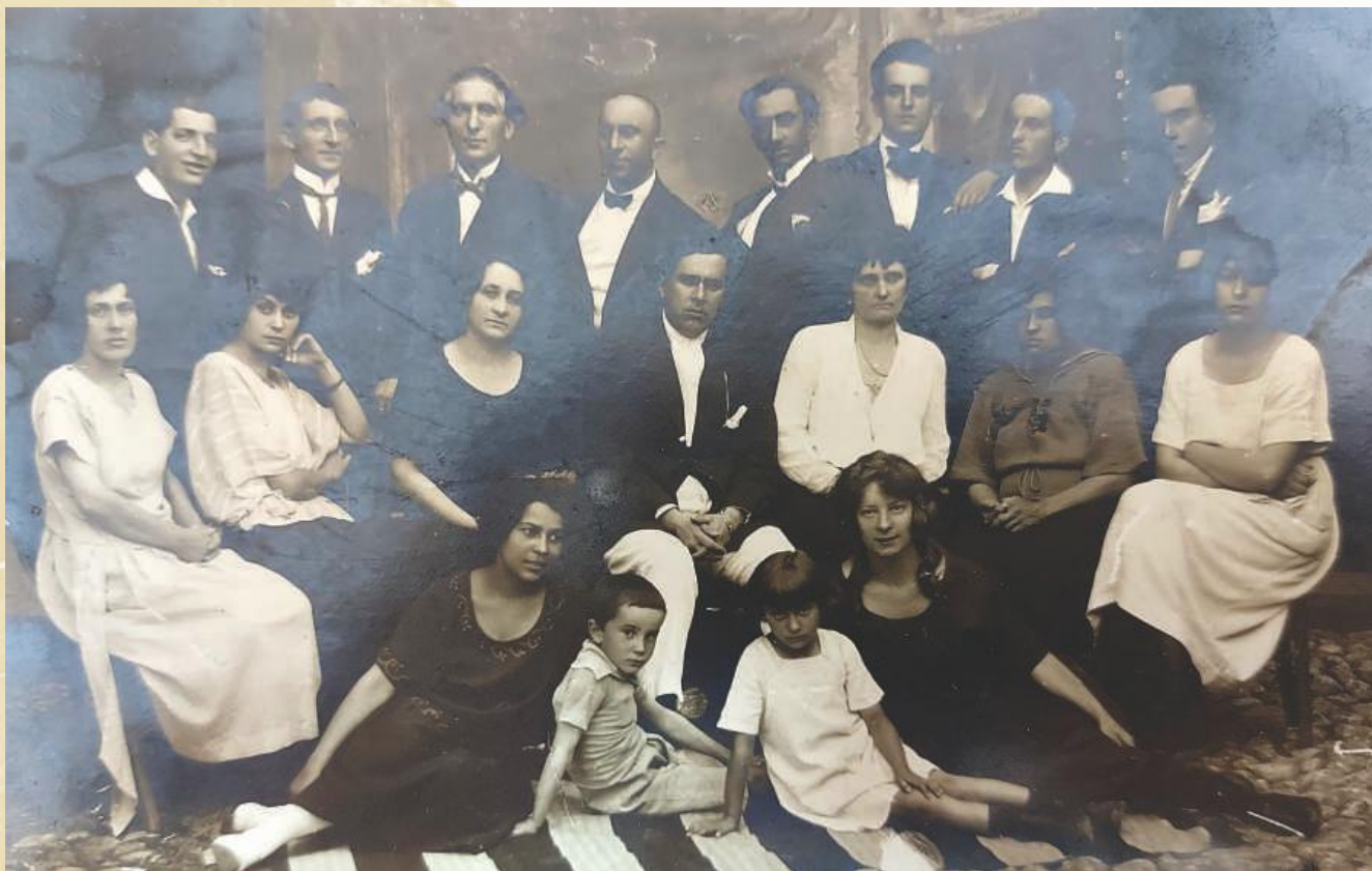
Подрињско повлашћено позориште у Ужицу, 8. јул 1922. године

Процес оснивања установа културе у међуратном периоду текао је споро, а културном садржају вароши велики допринос су давали програми културно-уметничких, хуманитарних и спортских друштава, који су имали висок културни и васпитни карактер. Друштва су имала секције – хорску, рецитаторску, драмску и музичку – и у међуратном периоду био их је већи број: Певачко друштво „Златиборска вила“, Културно-уметничко друштво „Абрашевић“, Друштво „Просвета“, Хуманитарно друштво „Наша нада“, Хуманитарно друштво „Гаравац“, Аеро-клуб, Коло српских сестара, пододбор Друштва „Књегиња