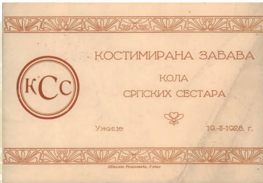
Позивница Кола српских сестара за костимирану забаву 1928. године