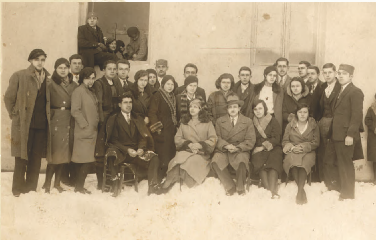
Школа игре у Ужицу, 1931. година

се „домаћин забаве“, лекар или апотекар који се бринуо за целокупну организацију, од закупа простора до програма игара.