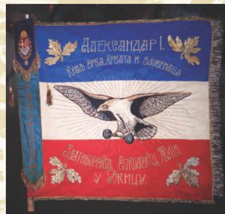
Застава Соколског друштва