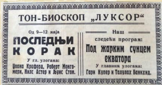
Реклама за Тон биоскоп „Луксор“, Ужички глас (1935)

Биоскоп, једно од сведочанстава урбаног развоја, почео је са радом почетком XX века. Као и у осталим градовима Краљевине Југославије, и у Ужицу су биоскопске представе у почетку пројектоване у кафанама. Први биоскоп, звани „Грбића арена“, отворен је у хотелу „Златибор“, а после њега су радили „Колосеум“ и Тон биоскоп „Луксор“.