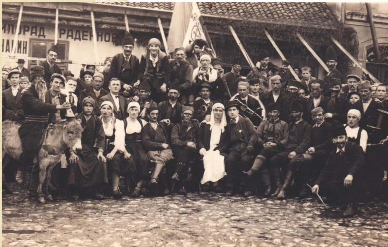
Маскирана свадба на Покладе 1936. године

Поред већ наведене делатности и програма установа културе и једног броја културно-уметничких друштава, у Ужицу су организоване забаве поводом одређених верских празника, друштвених догађаја, државних празника (Дан рођења краља, дан стварања нове државе), затим струковне забаве, као и породичне забаве.