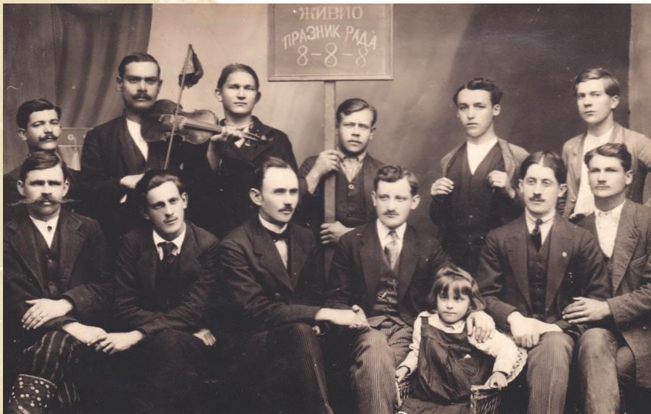
Обележавање Првог маја у Ужицу око 1928. године