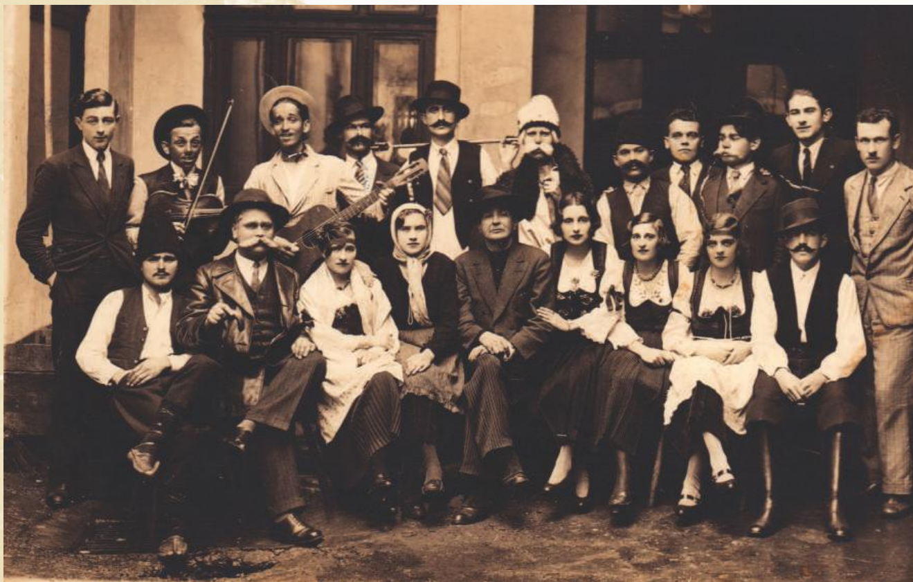
Аматерска позоришна дружина „Абрашевић“ 1934. година припремила је представу Сеоска лолa

Уједињена радничка уметничка група „Абрашевић“, основана пре Првог светског рата, више пута је престајала са радом да би се поново организовала 1935. године као секција београдског „Абрашевића“. „Абрашевић“ је окупљао напредну радничку омладину разних струка (обућаре, опанчаре, кројаче, бербере, металце) и друге заинтересоване грађане. Обновљена група „Абрашевић“ формирала је позоришну, хорску, рецитаторску и музичку секцију које су суботом,