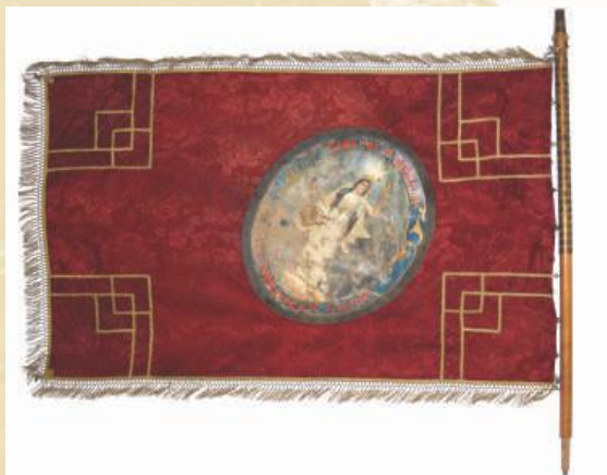
Застава Певачког друштва „Златиборска вила“