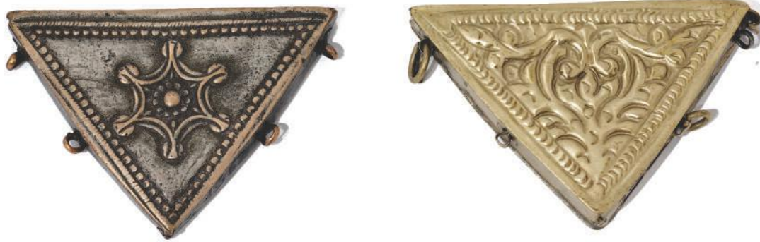
Два сребрна енамлука, искуцавање, Пријеполје, XIX век