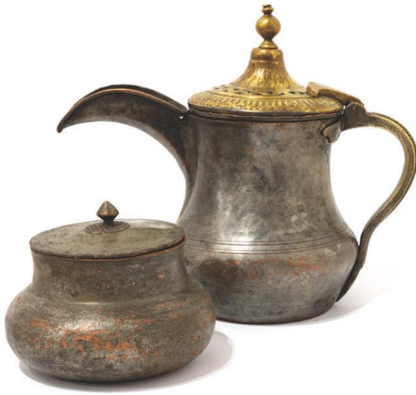
Ибрик „шербетњак“, бакар, XIX век, непознато порекло и бакарна посудуца с поклопцем, пронађена приликом грађевинских радова на Ракијској пијаци у Ужицу

Сачуваног керамичког посуђа из османског доба је далеко мање од бакарног, због крхкости материјала од којег је израђивано. Уз невелик број керамичких посуда, у Етнографској збирци Народног музеја Ужице чува се и један бокал од изничке мајолике, најфиније глеђосане керамике порцеланског сјаја, најчешће украшене цветним мотивима, посебно у османској уметности омиљеним лалама и каранфилима. Мајолика је била доступна само добростојећим власницима, док се обичан народ служио јефтином керамичком робом коју су израђивале бардагције.