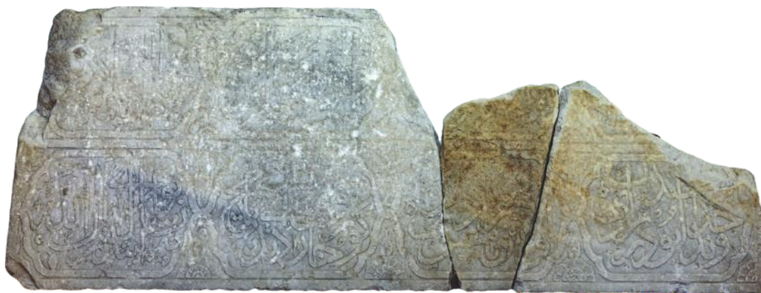
Остаци тариха са Касапчића моста