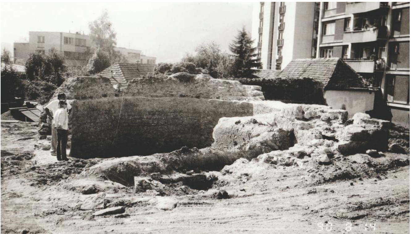
Уништавање локалитета „Шехова џамија“, Ужице, 1989/90. године.

Крајем осамдесетих година XX века започели су радови на изградњи стамбених зграда за потребе војске СФРЈ, у делу града Камено корито, на локалитету „Шехова џамија“. Током ископа земље појавили су се остаци велике грађевине, у којима су препознати остаци троделне олтарске апсиде и једне осмоугаоне грађевине, могуће турбета које је било подигнуто у комплексу џамије. Кустоси и археолози Народног музеја Ужице су покушали да заштите локалитет од даљег уништавања, али узалуд. Очувани зидови су порушени, а од 1990. године се на месту Шехове џамије, а могуће је и легендарне цркве Ружице, налази паркинг.