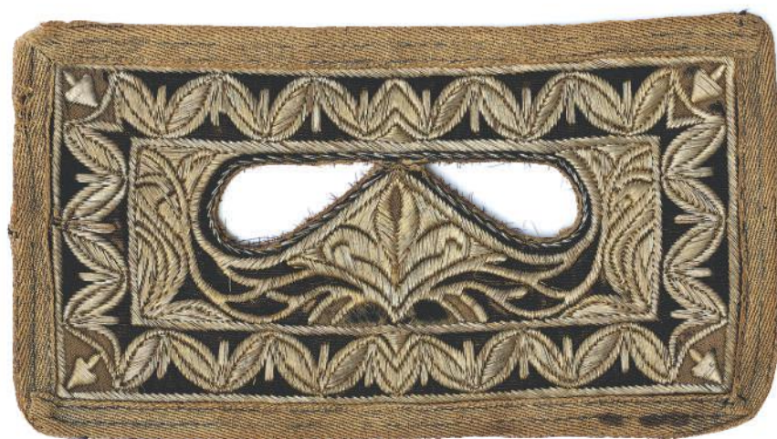
Печа, маска за лице, XIX век, Пријепоље, картон пресвучен чојом, вез памучним концем и срмом. Ношење оваквих маски био је један од видова покривања жена.

У имућнијим кућама су жене, чије је кретање било сужено на породичне посете, одлазак у куповину и повремене излете, биле углавном предано посвећене „дотеривању“; госте су примале „у пуној спреми“. 57 Преко дугачких широких кошуља (у данашњем поимању би то биле хаљина) жене су носиле антерију, горњу хаљину од чоје, свиле или баршуна. Некада су „доње хаљине“ чиниле краће кошуље са шалварама. Преко јелека (прслука) су носиле различите врсте капута. У поређењу са Европљанкама, до XX века утегнутих у корсете, муслиманке су се, у окриљу својих домова, без зара и фереце, у одећи која је поштвала природни облик тела, свакако осећале далеко угодније 58 . Муслиманке су носиле мале фесове, над косом обично уплетеном у кике, а коју су често красили и метални уплитњаци. Женски фесови су били плићи од мушких, а украшавани су кружним металним плочицама – тепедуцима. Папуче су ношене и у кући и ван ње, а оне од дрвета – нануле – жене су обувале и при одласку у хамам. Напољу су носиле и плитке чизме. 59