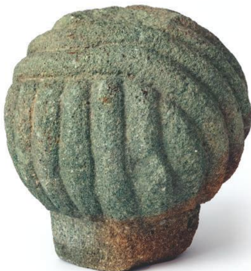
Узглавни нишан од гранита, Ужице, вероватно крај XVIII или XIX век; по облику турбана, закључује се да је покојник припадао трговачко-занатском слоју.

После овоземаљског живота, пребивалишта покојних означавали су нишани, подизани у пару – крај узглавља и крај ногу покопаног тела. У Народном музеју Ужице чува се већи број нишана, мушких, женских и дечјих (разликују се међусобно по облику, декорацији и величини), но на жалост, у време када су доспевали у Музеј, средином прошлог века, нису означени, нити су натписи на њима очувани. Једино што знамо је да већином потичу са ужичких мезарја – муслиманских гробаља.