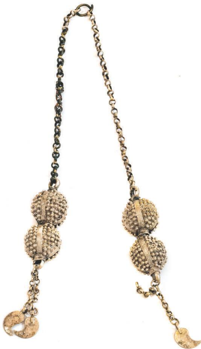
Уплитњак, сребро, филигран, гранулација, Забрњица код Прибоја

Накит је био одраз друштвеног статуса, а онај вреднији је у нестабилним приликама често служио као залога. У зависности од имовног стања, жене и мушкарци носили су накит од злата, сребра, лима, бронзе, који је могао бити украшен уметањем драгог или полудрагог камења, или стакла, те техникама филигран, гранулације или савата. 60 Код османских жена су веома цењени били и бисери, и често су чинили део наушница. Прса су красили надгрудници и различити типови огрлица; богатство породице истицале су ниске златника, а жене из скромних кућа носиле су и огрлице украшене бакраним новчићима.