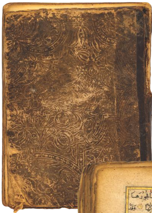
Књига инв. бр. 3438