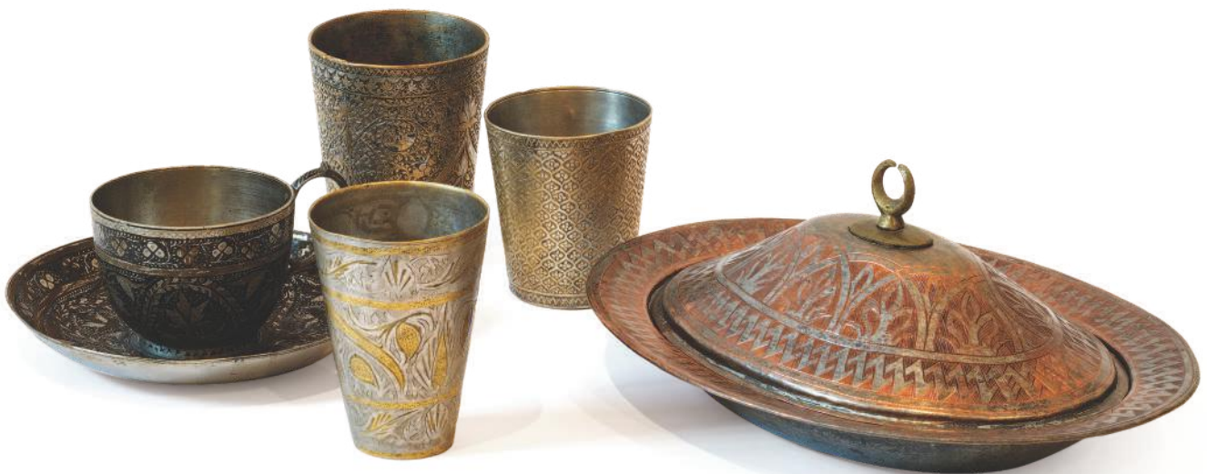
Сахан, бакар, калај, гравирање, XIX век, Ужице; три ливене и гравиране чаше, Пријеполје, вероватно XIX век; шоља за чај са таџном, Пријеполје, XIX век, посребрени бакар, сават техника.

У кухињи су највише коришћени бакарни судови, а имућнији су се служили и из сребрних или посребрених. Метално посуђе – сахане, тањире, чаше, ибрике, ђугуме, синије, израђивале су казанџије. Бакарно посуђе је калајисано, како би се спречило тровање (бакар у додиру с топлотом хране ослобађа штетне супстанце). Било је вредан део покућства и није се тек тако одбацивало, те су мајстори калаџије „крпили“ оштећене судове. Кујунџије су метално посуђе украшавале сплетовима орнамената, а каткад су на њему калиграфским писмом исписивани и стихови, или подаци о власнику.