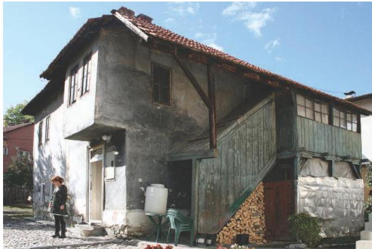
Једина евидентирана стара муслиманска кућа у Ужицу, прилично великих димензија, налази се крај десне обале Коштичког потока.

Данас у Ужицу постоји свега једна кућа за коју се поуздано може тврдити да су је градили муслимани за своје потребе, мада су многе грађевине које су припадале типу балканско-оријенталне архитектуре (једна од њих је и Јокановића кућа) називане „турским“. Балканско-оријентална архитектура је у основи дериват исламске, но неке разлике, пре свега у распореду унутрашњег простора, указују да је то било градитељство предвиђено за домове хришћанских породица.