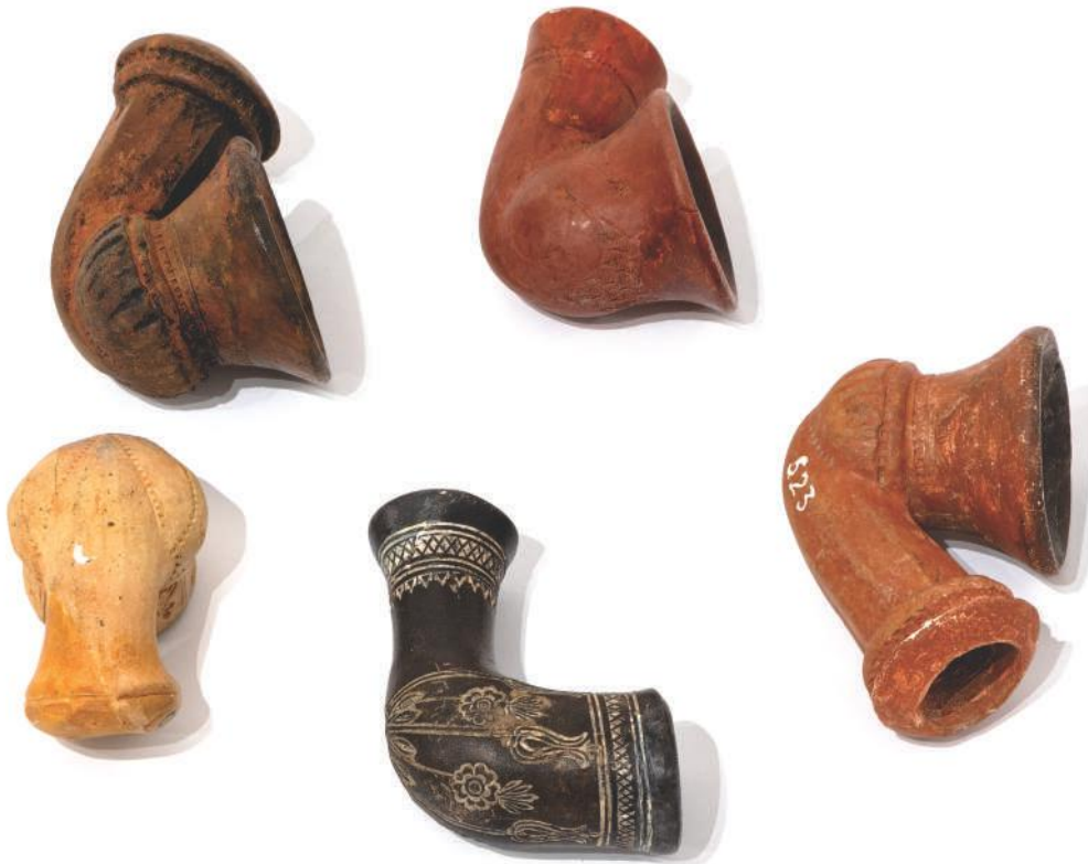
Керамичке луле, Ужице

Дуван се пушио на луле и наргиле (водене луле), док су међу Османлијама цигарете стекле популарност тек пред крај Царства. 67