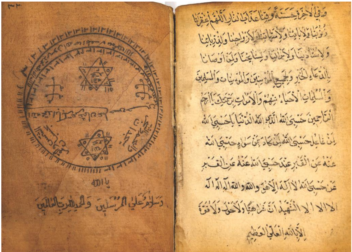
Меџмua, инв. бр. 2725

На листовима рукописа који се налазе у збирци Музеја налазе се имена неких писмених људи који нису били велике историјске личности, али се без сумње може тврдити да је њихов утицај на живот у срединама у којима су живели био велики. Још је замагљенија слика о анонимним преписивачима и корисницима књига, а најтеже је допрети до оних са којима су писмени људи комуницирали, које су подучавали или им помагали на овај или онај начин. Оно што рукописи, међутим кажу, јесте да су неки од тих људи знали кад и како се треба молити, да су упутства за правилан и ефикасан молитвени живот писали на турском, а молили се на арапском. Многи од њих вероватно никад нису чули како звучи арапски као матерњи језик, али су неки свакако располагали описом сваког појединачног гласа и места његовог настанка. Рукописи такође кажу да су религија и сујеверје стајали руку под руку (сл. 5310). Даље кажу да су легенде и приче биле подједнако важне као и догматски принципи. Рукописи нас наводе да се запитамо како су људи који су живели у предмодерном Ужицу, Пријепољу, Пљевљима итд., успевали да набаве биљке из далеких крајева света и разне хемијске супстанце које су онда користили за справљање мелема, тинктура, и балзама разних намена. Шта је лек за сваку бољку? Како се одвикнути од опијума? Како се окрепити на врућини? Шта да ради мајка која нема млека — шта да пије, како да се моли, коју амајлију да носи испод пазуха? И тако даље, и тако даље.