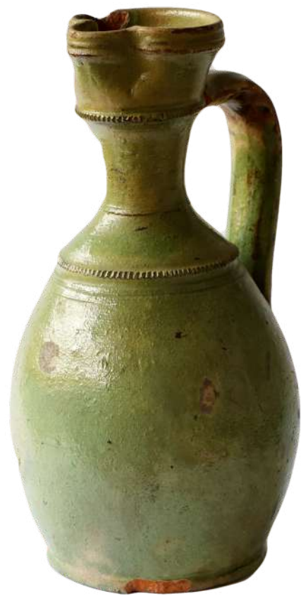
Посуда за воду од глеђосане керамике, са перфорираним отвором, пронађена на месту данашњег Трга партизана у Ужицу, служила је за поливање.