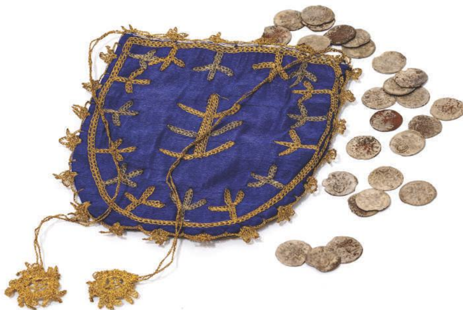
Врећица за новац какву су носиле имућније муслиманске девојке; Пријеполје, XIX век, свилени атлас, златовез; око ње су турски новчићи из Нумизматичке збирке Музеја.