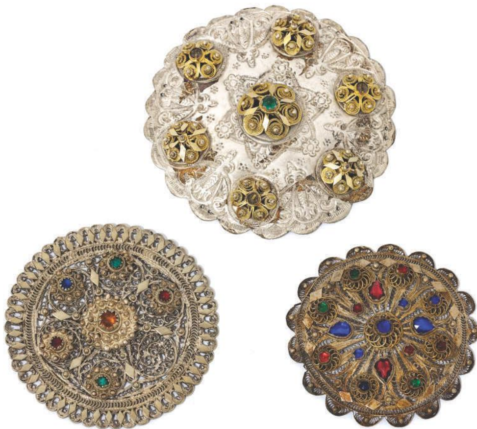
Тепелуци различитог типа из Етнографске збирке музеја