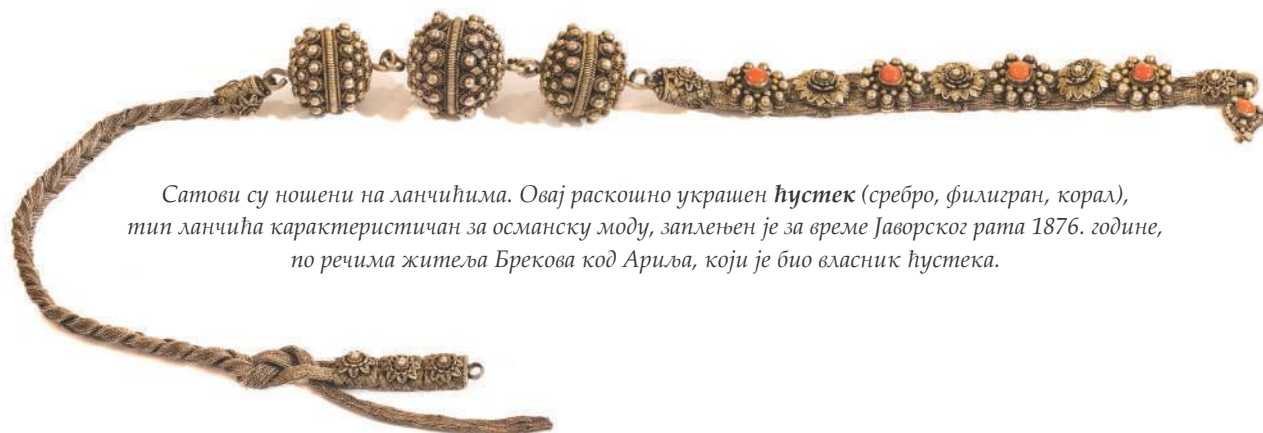
Сатови су ношени на ланчићима. Овај раскошно украшен ћустек (сребро, филигран, корал), тип ланчића карактеристичан за османску моду, заплећен је за време Јаворског рата 1876. године, по речима житеља Брекова код Ариља, који је био власник ћустека.

И поред раскоши у женском одевању, идеална муслиманка је у јавности, уколико то није био женски хамам, била – невидљива. Тело су прекривале широким одорама – ферецама, а косу и лице марамима и веловима ношеним на различите начине. За жене на селу које су се бавиле пољским пословима, ти прописи нису могли бити тако строго примењивани.