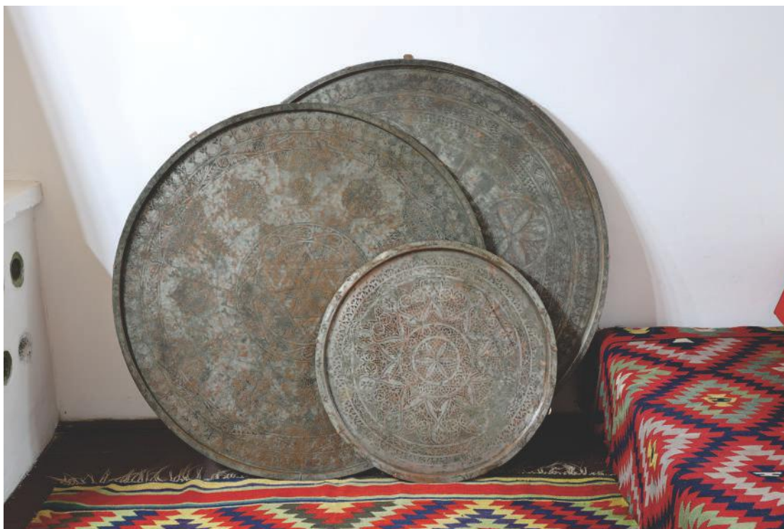
Оријентална соба у Јокановића кући, једна од сталних поставки Народног музеја Ужице; уз зид су наслоњене сивије демирлије, са којих је служена храна.