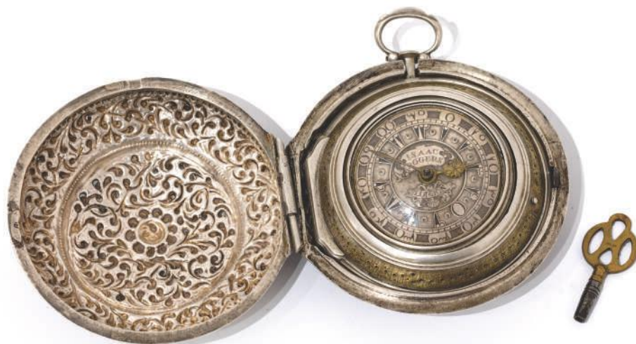
Сребрни сат, механизам израђен у фирми „Isac Rogers“ из Лондона, вероватно средином XVIII века, у сребрној кутији, која је свакако рад неког османског кујунџије.

У трговачко-занатским круговима, а већина ужичких муслимана је припадала том слоју, уредности и дотераности придавао се велики значај. 54 Мушкарци су преко кошуља обично облачили џемадан или ђечерму (прслуци), а преко њега доламу (кратки капут), те дуже горње хаљине попут антерије. Чакшире су биле употпуњене тозлцима (сукнене доколенице). Појасеви су могли бити извезени или начињени од материјала тканог у више боја. На глави се носио фес, а када је био обавијен шалом, називао се чалма (сарук). 55 У свечаним приликама, мушкарци су за пасом могли носити и оружје, као ознаку свог достојанства и положаја, а питање престижа код Османлија било је и поседовање сата. Сатни механизми су увожени са Запада, а на њиховим бројчаницима, прилагођено тржишту Оријента, бројеви су често исписивани арапским писмом. Кутије у које су механизми били смештени често су биле рад домаћих кујунџија, као и ланци на којима су сатови ношени. 56