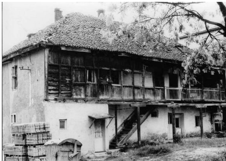
Зотовића кућа, тако називана по породици у чијем је власништву једно време била, заправо је некадашњи турски трговачки хан из XIX века – Морића хан. Кућа је почетком седмдесетих година XX века порушена, а по сећању једног од њених некадашњег становника, таванице су средином прошлог века још увек биле осликане апстрактним орнаментом, по свему судећи из османског доба. 47