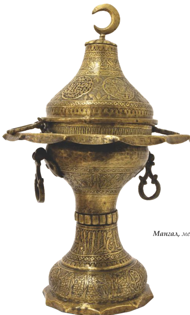
Мангал, месинг, Пријеполје, XIX век