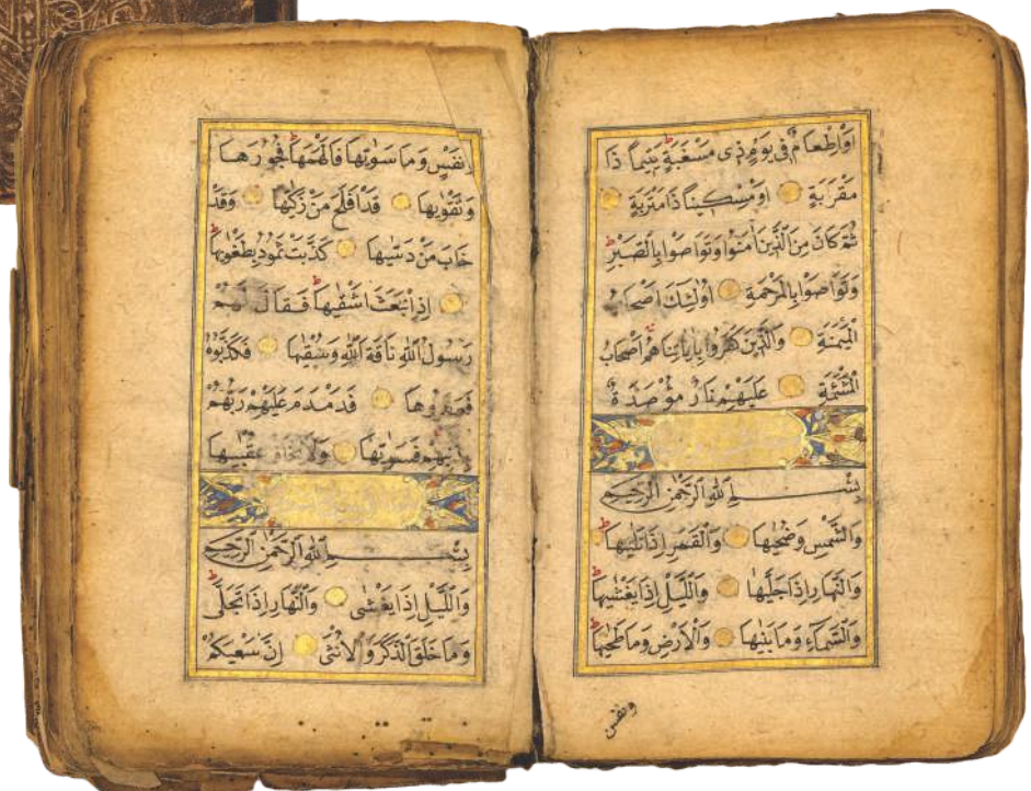
Књига инв. бр. 2668