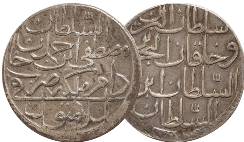
Сребрњак султана Мустафе III, искован 1757. године

До XIX века су предмети покућства били малобројни, и тешко да би се шта могло додати онима које смо већ поменули – неке породице поседовале су и рахле (постоље за Куран), или зидни сат. Унутрашње уређење можда је најбоље одавало дух номадске традиције: није било масивног намештаја, који би загушио невелики простор, а украшене тканине су се могле наћи у готово свим кутовима куће. У кућу се није улазило у обући која се носила напољу, а по собама се ходало у собним папучама.