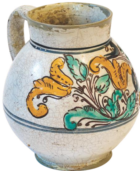
Бокал, вероватно XVII век, измирска мајолика пронађена у Ужицу у близини Народног музеја Ужице

Сачуваног керамичког посуђа из османског доба је далеко мање од бакарног, због крхкости материјала од којег је израђивано. Уз невелик број керамичких посуда, у Етнографској збирци Народног музеја Ужице чува се и један бокал од изничке мајолике, најфиније глеђосане керамике порцеланског сјаја, најчешће украшене цветним мотивима, посебно у османској уметности омиљеним лалама и каранфилима. Мајолика је била доступна само добростојећим власницима, док се обичан народ служио јефтином керамичком робом коју су израђивале бардагције.