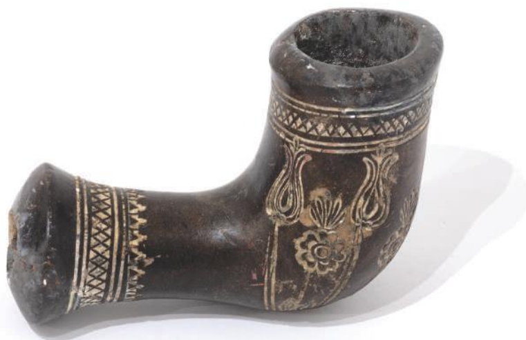
Лула, Ужице, керамика, урезан орнамент