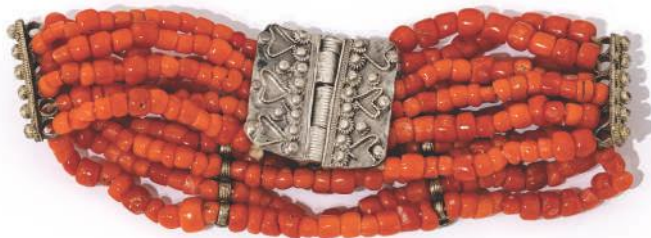
Наруквица, корал, сребро, Пријеполје, XIX век