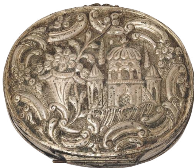
Сребрна табакера из музејске збирке са представом џамије. Орнамент је изведен под западњачким утицајем.

У доба барока и рококоа долази до уплива западних образаца у османске декоративне уметности, но оне су се, као и османска уметност у целини, развијале у оквиру установљене традиције све до половине XIX века, када се у великој мери окреће Европи.