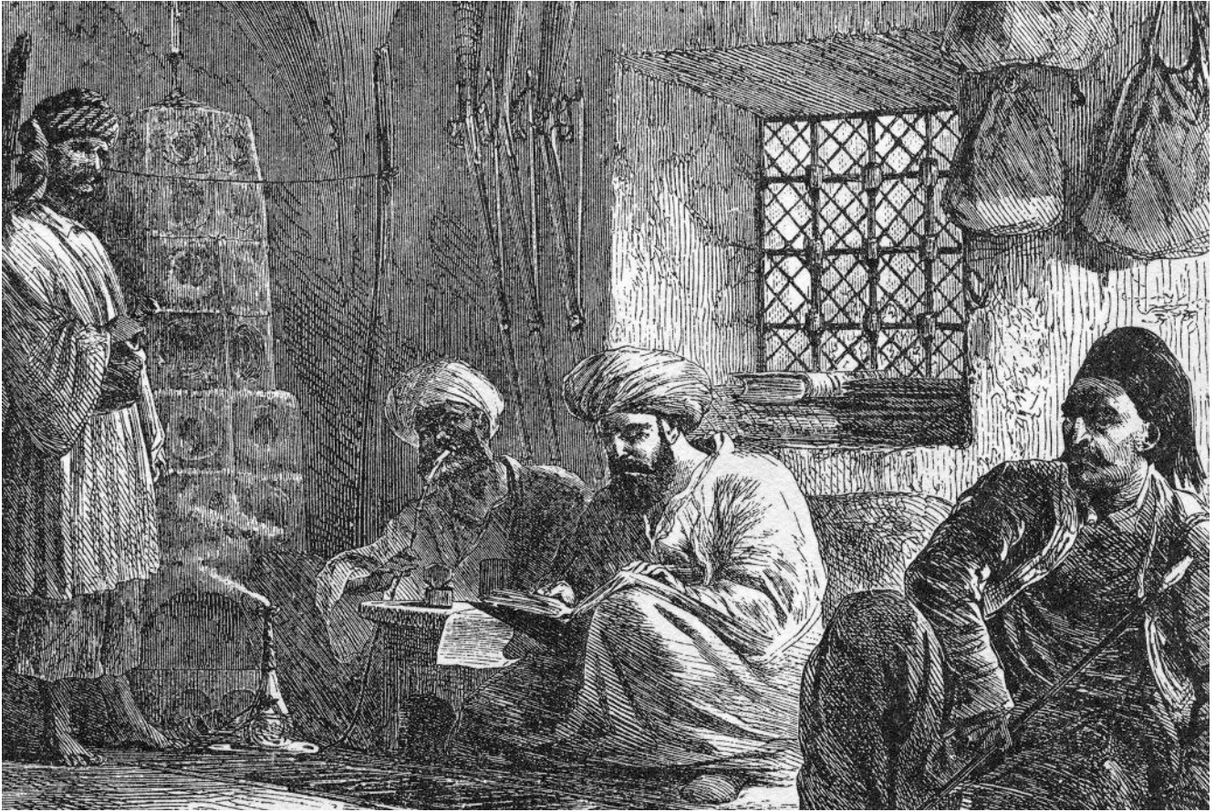
Ужице, судница мудира Ибрахим бега 1860. године (илустрација Феликса Каница)

Ами Буе, француски геолог, географ и ботаничар, у Ужицу је кратко боравио 1854. године, о чему је оставио белешку у ревидираном издању свог дела о европској Турској: „Град, изграђен на тлу јако неуреданом, исто као у Босни, сачињен је од једне уске улице с дућанима и великог броја белих кућица, расутих и окружених оградом. Броји 897 кућа или 4.402 душе, међу којима 3.695 чине Словени мухамеданци, који заузимају 732 куће. То је седиште главног заповедника и суда округа Ужице, тако исто и центар епископије.“