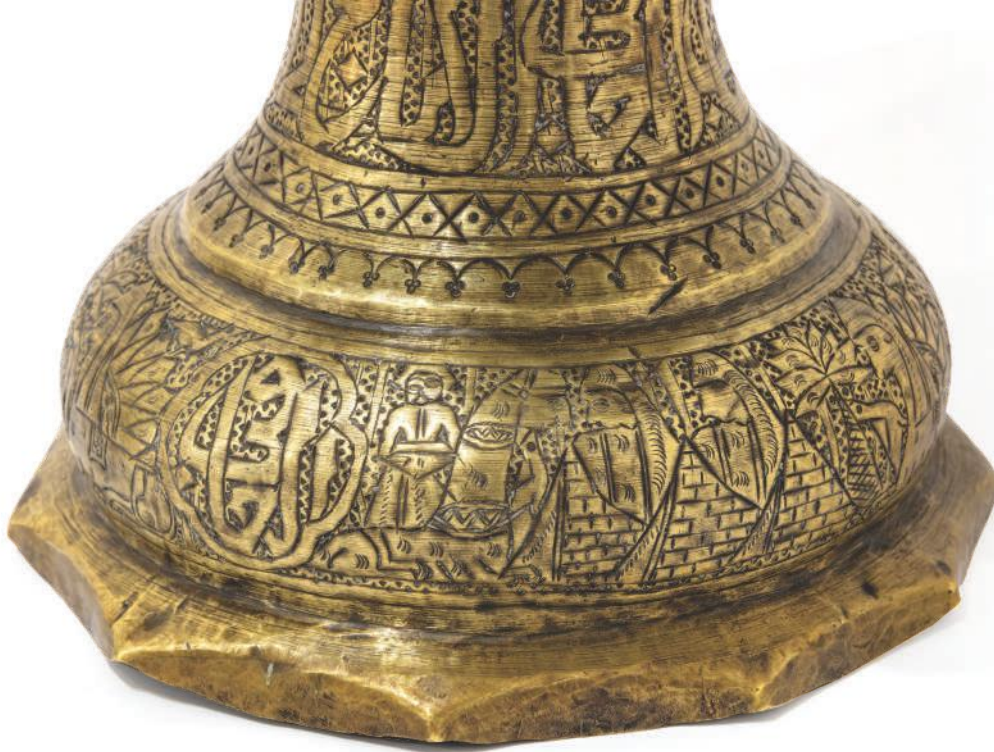
Мангал, Пријепоље, XIX век, месинг. Представе са људским и митским фигурама воде порекло из уметности Персије и култура старог Блиског Истока.

Архитектура. Градове Османског царства западни путници сматрали су местима урбанистичког нереда, што са становишта нововековне Европе углавном и јесу били. Међу начичканим махалама било је мало слободног простора, а комуникацију је отежавао и велики број ћорсокака.