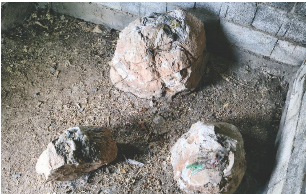
Остаци свећа попаљених на месту на погубљења Шејха Мухамеда у Балотићима указују на трагове криптохришћанства међу народом рожајског краја.